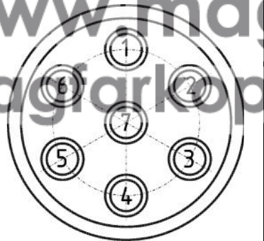
Схема обрезки кабеля