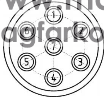
Схема обрезаки кабеля