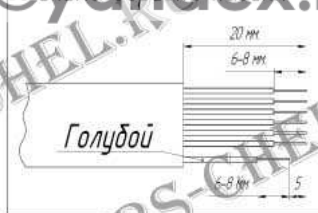
Схема обрезки кабеля